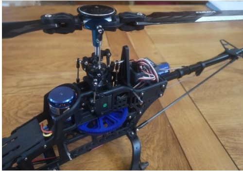
Tête rotor bi-pale