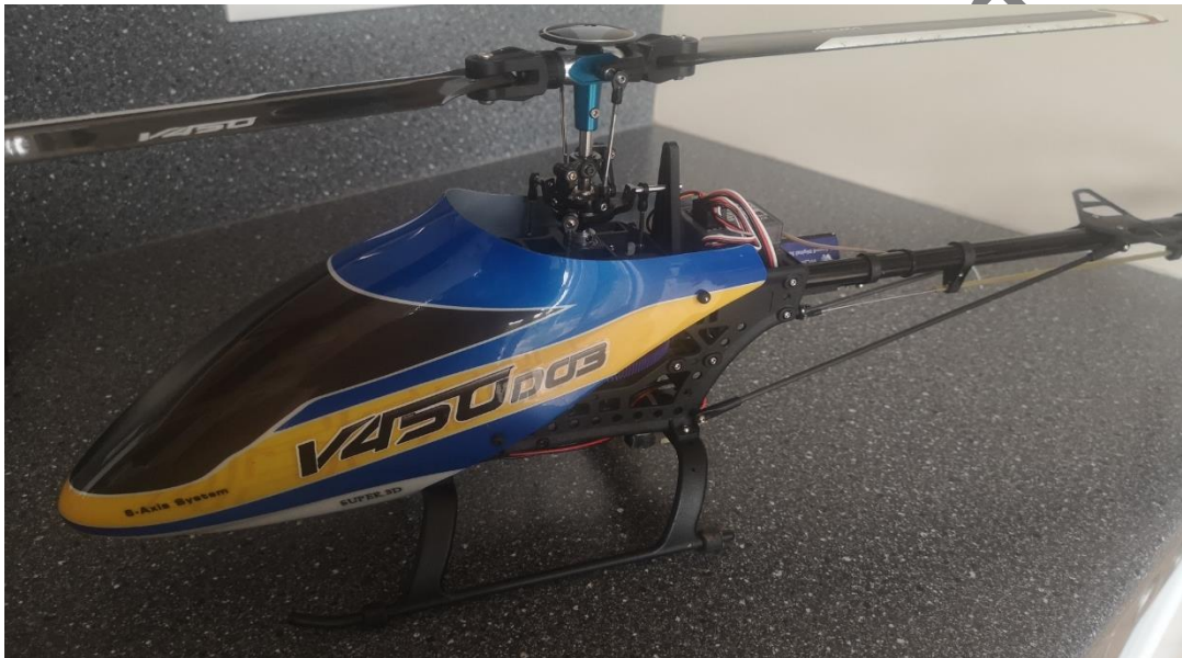
Photo de la machine de base

Je vais partir d'une machine de classe 450, le VD450D03 de chez Walkera (mais pour les autres, la démarche reste strictement identique que ce soit en taille de classe ou d'autres marques)