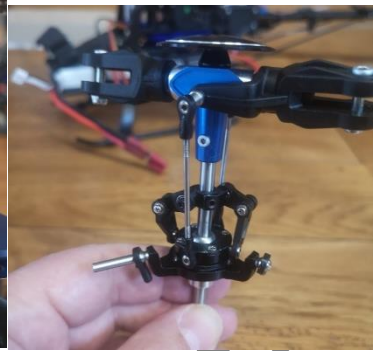
Tête complète démontée

Jusqu'à là rien de sorcier, on enlève les chapes, on retire la vis qui relie la couronne d'entraînement et le mat rotor et on sort l'ensemble (tête ; plateau cyclique et mat rotor).