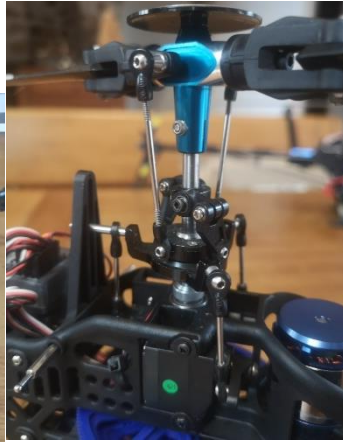
plateau et entraineur